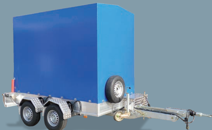
• Höhenverstellbare Deichsel